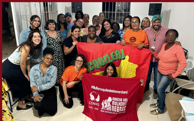
Visita do Incra e Defensoria Pública na comunidade

A Associação de Remanescentes Quilombolas de Lagoa Feia e Sossego é importante na organização e fortalecimento da comunidade, representando-a de forma política, social e cultural. Ela articula as demandas coletivas, os direitos do território e o acesso a políticas públicas para as famílias quilombolas. Recentemente, renovou sua diretoria com novas lideranças em prol da coletividade. Abaixo seguem os atuais cargos da diretoria: